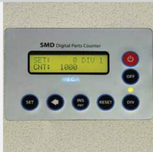
Simple Operation Keys