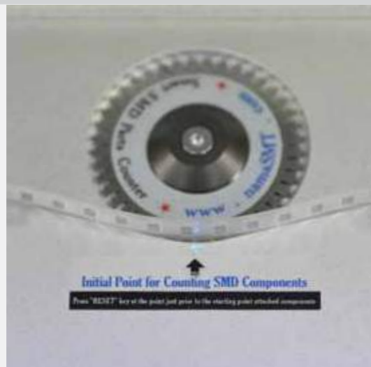
Initial Point for counting SMD components